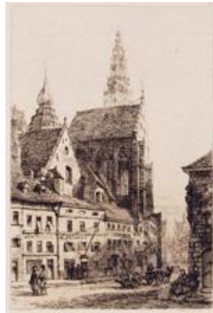
ANTWERP The Cathedral of Notre Dame PLATE XIX