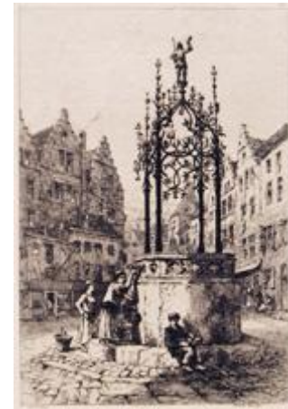
ANTWERP Well-Cover by Quentin Matsys PLATE XX